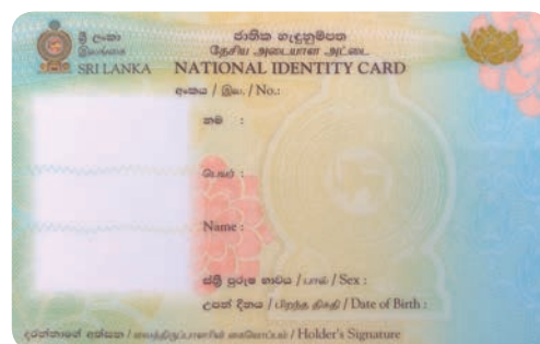
carte d'identité sri-lankaise