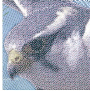
graphiques de sécurité