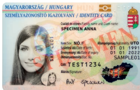
carte d'identité hongroise