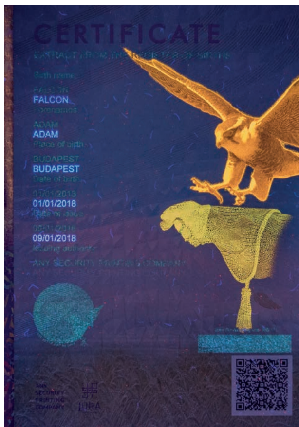
personalisation with UV fluorescent inks

Nous offrons une ligne de production complète pour la personnalisation décentralisée, dont une imprimante laser munies d'un toner spécial et d'une unité de plastification à cylindre chauffé. Ce produit combine le faible coût des imprimantes disponibles dans le commerce et la sécurité des imprimantes spéciales.