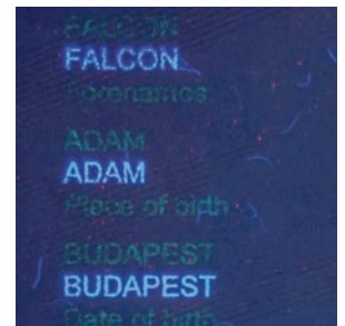
Personnalisation avec encres de sécurité uniques, bifluorescentes UV