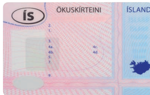
permis de conduire islandais