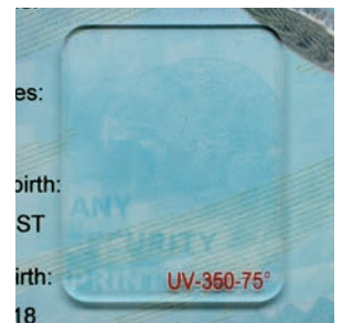
Jura IC™ (Information Constante Invisible)