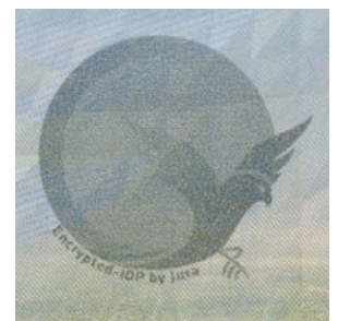
Encrypted-IDP (Protection de Document Invisible) de Jura