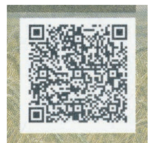
Jura IQ-R anti-copie code QR décodage par application mobile