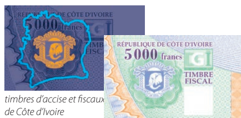
timbres d'accise et fiscaux de Côte d'Ivoire

ANY Security Printing Company PLC Halom utca 5, Budapest 1102, Hungary Phone: +36 1 431 1200 E-mail: info@any.hu www.any.hu