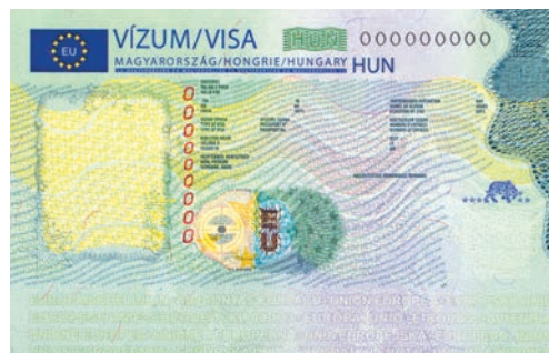
vignette visa Schengen

Nos produits sont fabriqués à l'aide d'une technologie de pointe et des connaissances professionnelles novatrices de notre personnel. Nos références, notre technologie spéciale et notre préparation à la sécurité garantissent que nous pouvons offrir le meilleur produit possible à nos clients. N'hésitez pas à contacter notre personnel si vous avez des questions.