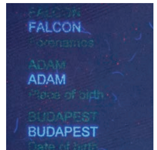
Personnalisation avec encres de sécurité uniques, bifluorescentes UV