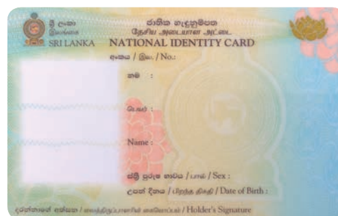
carte d'identité sri-lankaise