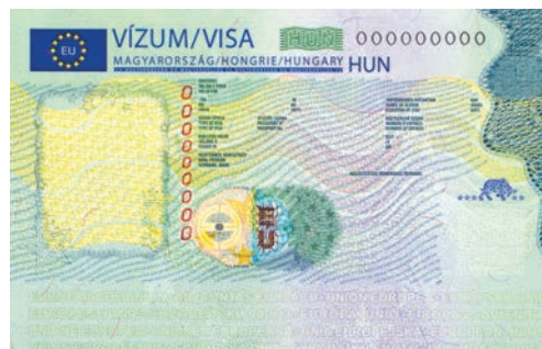
vignette visa Schengen

ANY Security Printing Company PLC Halom utca 5, Budapest 1102, Hungary Phone: +36 1 431 1200 E-mail: info@any.hu www.any.hu