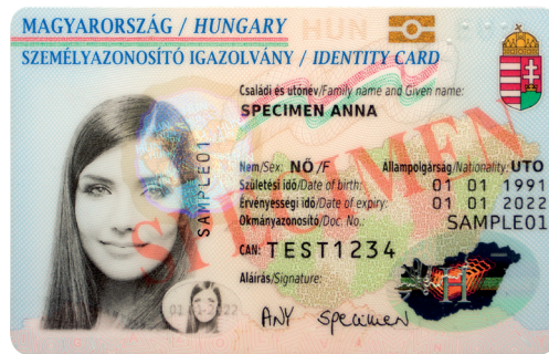
Tarjeta eID húngara