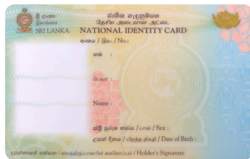
Tarjeta de identificación de Sri Lanka