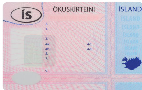
Permiso de conducir de Islandia