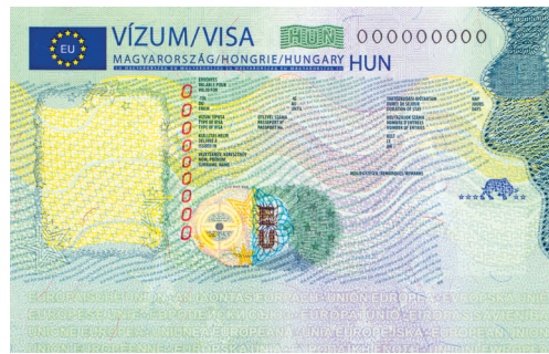
Etiqueta de visado Schengen

ANY Security Printing Company PLC Halom utca 5, Budapest 1102, Hungary Téléphone: +36 1 431 1200 E-mail: info@any.hu www.any.hu