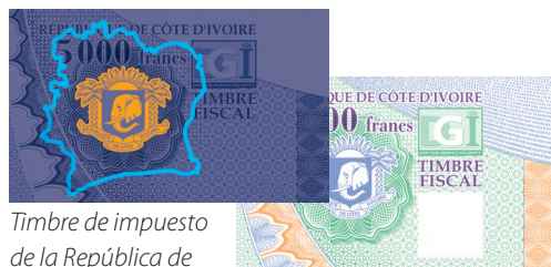
Timbre de impuesto de la República de Costa de Marfil